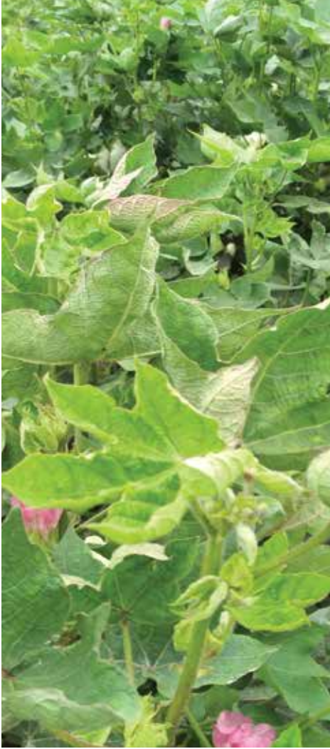
غیر استعمال شدہ