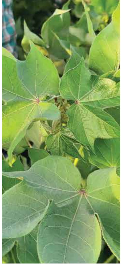
ریڈینٹ سے استعمال شدہ

زہری زہر سے احتیاط ہونے کی صورت میں گورنمنٹ کے نمائندے سے مشاورت کیلئے فون نمبر 042-35246055 پر رابطہ قائم کریں۔